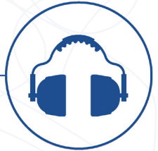
Oordopjes of oorkappen